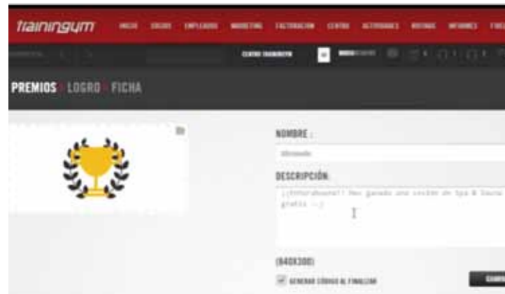
Figura 1. Herramienta de gamificación para el entrenamiento.